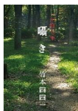
囁き 竹本 四四一