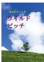
ワイルドピッチ 島田 駱舟