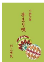
手まり唄 川上 咲良