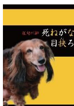
死ねがな目録 ねたがまし