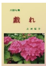
戯れ 土屋 暢子