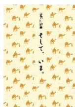
そして、いま。 川柳同友会みらい