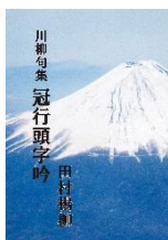
冠行頭字吟 田村 楊柳