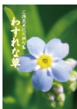
わすれな草 三瀬 芙美代