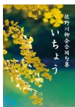
いちよう 佐野川柳会