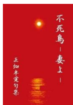
不死鳥 妻よ 正畑 半覚