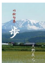
歩 大野 直之